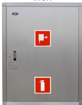
szafka przykładowa - szlif 240