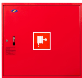
szafka przykładowa - kolor RAL 3000