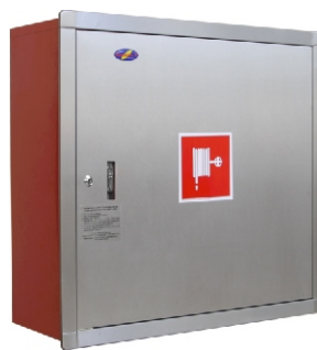
szafka przykładowa - szlif 240