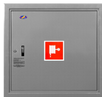
szafka przykładowa - kolor RAL 9006